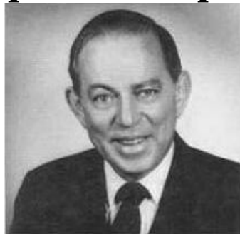
DAVID JOSEPH SCHWARTZ DOCTOR EN FILOSOFIA

Aprenda los secretos del éxito y alcance lo que siempre ha querido